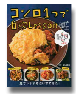
金丸絵里加／料理、主婦の友社、2019年 所蔵：中央・東中野

小さなキッチンでも、工夫次第で簡単調理！この本で扱うレシピには、なんと包丁・まな板・ボウルどれも必要なし。