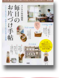
宝島社、2014年 所蔵：中央