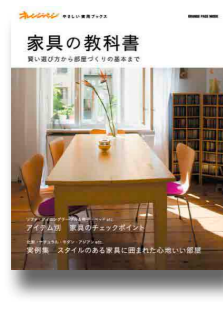
オレンジページ、2010年 所蔵：中央・鷺宮

意外と知らない家具の基本がわかる本。構造や素材、状況に合わせた選び方など、図解でわかりやすく学ぶことができる。北欧・ナチュラル・モダンなどのスタイル別の実例集で好みの部屋を探すのも楽しい。巻末には家具用語辞典、家具の安全性に関する表示の見方など便利なコラム付き。