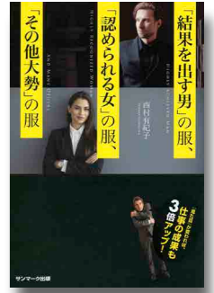
西村由紀子／著、サンマーク出版、2016年 所蔵：江古田

ビジネスで成功する人物になるためのファッション心得本。見た目は実力と同じくらい大切であるとし、様々なテクニックを紹介している。ビジネスシーンで必要なのは、センスやお金ではなく正しいセオリー。春から社会人になる人も、そうでない人も、服装を見直して、仕事を有利に進めてみてはどうだろう。