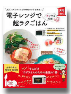
主婦の友社／編 主婦の友社、2016年 所蔵：中央・上高田

電子レンジで超ラクごはん 本書で紹介するのはすべて電子レンジでチン！するだけのおまかせレシピだ。基本は、①具材を耐熱容器に入れる、②レンジでチンする、③そのまま蒸らす。のたったの3ステップで料理が完成する。電子レンジ調理は、加熱中に手が空く、洗い物が少ない、油が少なく済む、などメリットがたくさんある。この機会にぜひお試しあれ。