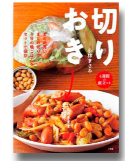
小林まさみ／著 小学館、2018年 所蔵：中央

レシピページの指示は丁寧で、手順ごとに写真を掲載しているのでとてもわかりやすい。料理の基本をまとめたページもあり、初心者嬉しい内容となっている。