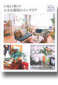
成美堂出版編集部／編、成美堂出版、2017年 所蔵：鷺宮

この春から新しい部屋や家に住む人もいるだろう。せめて家にいる間はリラックスして過ごしたいもの。強いこだわりはなくとも、自分にとって心地良い部屋を実現したいところだ。本章では基本的な部屋づくりの方法、家具や収納についての本を紹介する。この機会に快適な暮らしを手に入れてみてはいかがだろうか。