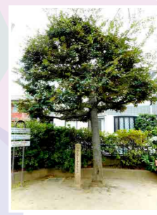
所在地：野方二丁目61番 撮影日：2019 (平成31)年2月26日

1973 (昭和48)年7月28日に開園。野方図書館から徒歩約5分。野方駅を背にして環七通りを南へ進む。2つめの歩道橋(啓明歩道橋)手前の駐車場の脇の細い路地を左折し、少し歩くと左側にある。