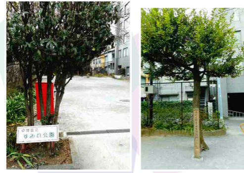
所在地：中野五丁目5番 撮影日：2019 (平成31)年2月26日

1973 (昭和48)年12月6日に開園。中央図書館から徒歩約10分。図書館を背にもみじ山通りを北へ進み、早稲田通りを左へ。しばらく歩くと左側にある。