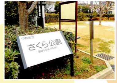
所在地：中野六丁目2番 撮影日：2019 (平成31)年2月27日

公園の様子 桜の木、ベンチ、すべり台、砂場などがある。近隣に明治大学付属中野中学校があり、取材時には学生達の元気な声が聞こえた。